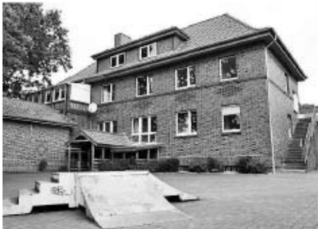
Am Kindergarten in Rötgesbüttel: Möglichkeiten für einen Umbau des Durchgangs prüfen.

Frank Schlimme (W.i.R.) hielt dagegen, die Entfernung der Treppe ermögliche auch Rollstuhlfahrern kürzere Wege. Jetzt soll der auch für die Krippe zuständige Architekt Möglichkeiten für einen Umbau aufzeigen und Kosten ermitteln.